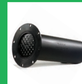
6 Stufen Filtereinsatz